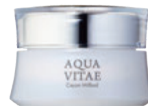
アクアビーテ・ クリームウィラード

アクアビーテは注目の美容成分「NMN」を贅沢に配合したエイジングケアライン。乾燥・くすみ・ハリ不足・しわ・たるみ・ほうれい線など、さまざまな肌悩みにアプローチします!