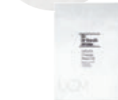
Dr.ウィラード・ うるおいチャージマスクVE 20mL×1枚 1,100円(税込)