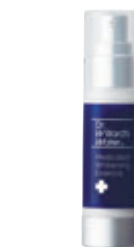
アクアビータ・ モイスチュアサイエンス 30mL 12,650円(税込)