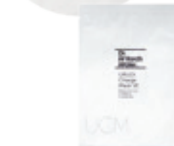
Dr.ウィラード・ うるおいチャージマスクVE 20mL×1枚 1,100円(税抜1,000円)