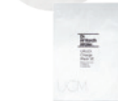
Dr.ウィラード・ うるおいチャージマスクVE 20mL×1枚 1,100円 (税抜1,000円)