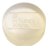
Dr.ウィラード・ フェイシャルソープ 90g 2,970円 (税抜2,700円)