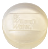
Dr.ウィラード・ フェイシャルソープ 90g 2,970円(税抜2,700円)